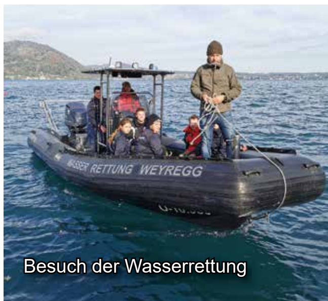
Besuch der Wasserrettung