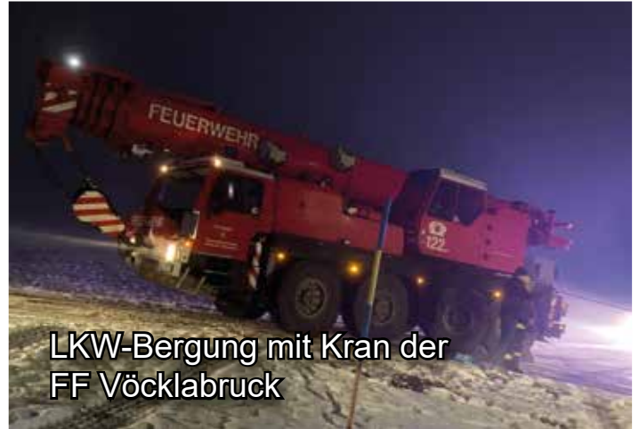
LKW-Bergung mit Kran der FF Vöcklabruck

Die FF Frankenmarkt sucht Frauen und Männer zur Verstärkung ihrer Schlagkraft.