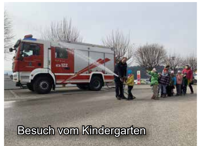
Besuch vom Kindergarten