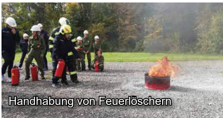
Handhabung von Feuerlöschern