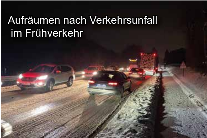
Aufräumen nach Verkehrsunfall im Frühverkehr