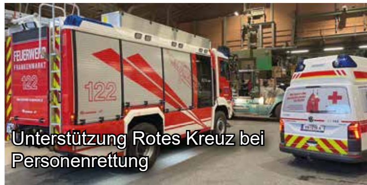
Unterstützung Rotes Kreuz bei Personenrettung