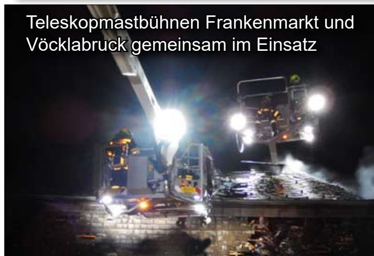
Teleskopmastbühnen Frankenmarkt und Vöcklabruck gemeinsam im Einsatz