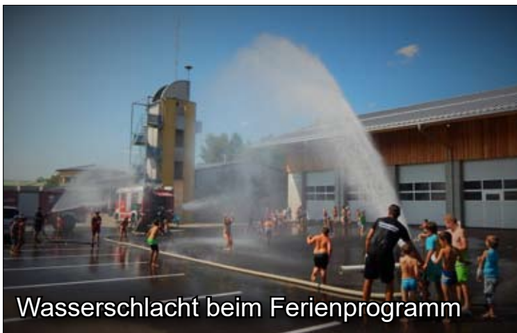
Wasserschlacht beim Ferienprogramm