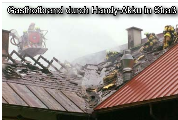
Gasthofbrand durch Handy-Akku in Straß