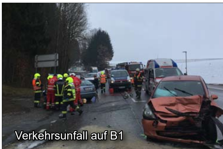
Verkehrsunfall auf B1