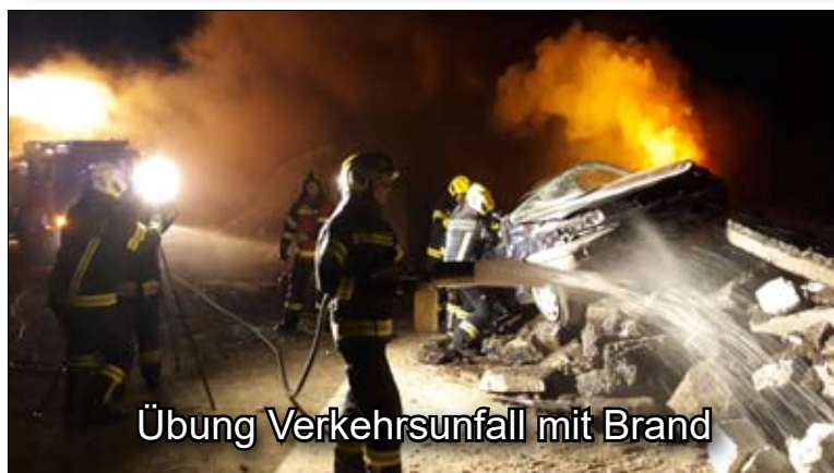
Übung Verkehrsunfall mit Brand