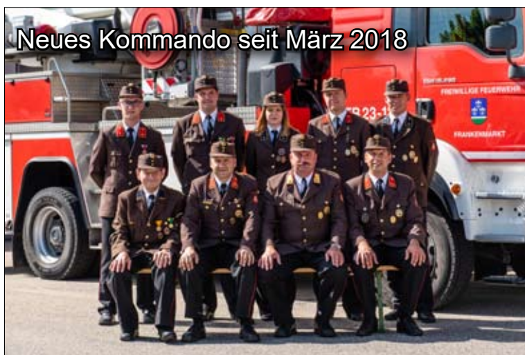
Neues Kommando seit März 2018