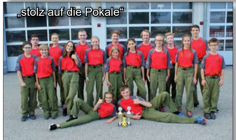
„stolz auf die Pokale“