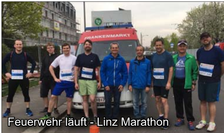
Feuerwehr läuft - Linz Marathon