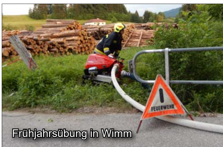
Frühjahrsübung in Wimm