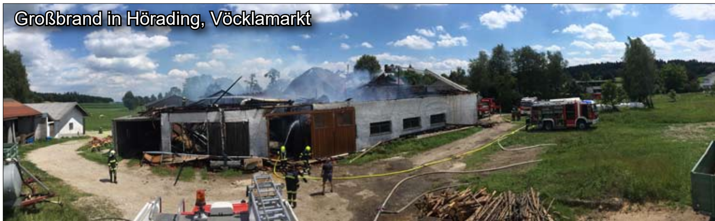
Großbrand in Hörading, Vöcklamarkt