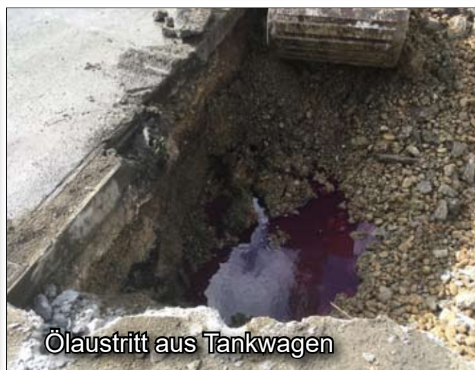
Ölaustritt aus Tankwagen