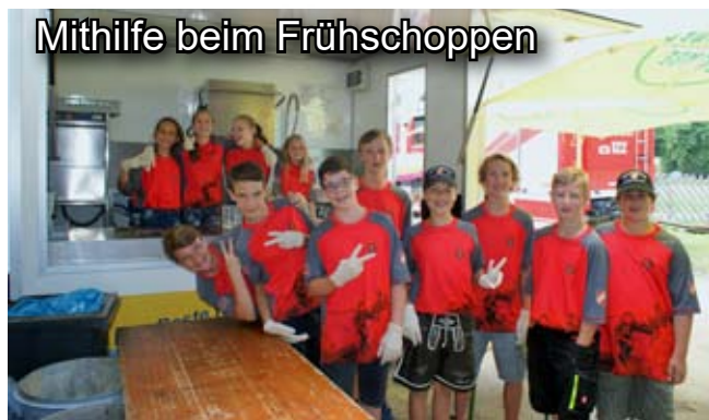
Mithilfe beim Frühschoppen