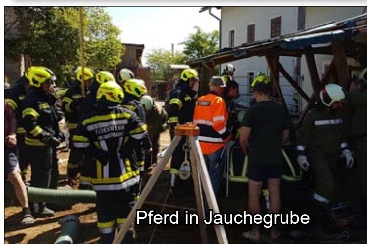
Pferd in Jauchegrube