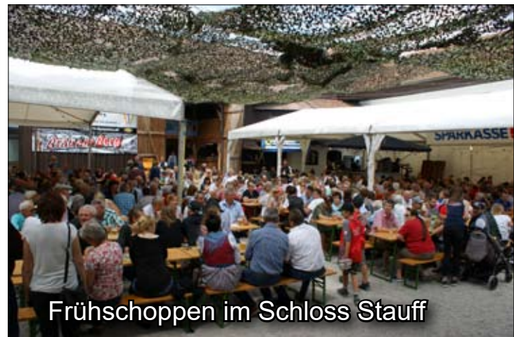
Frühschoppen im Schloss Stauff