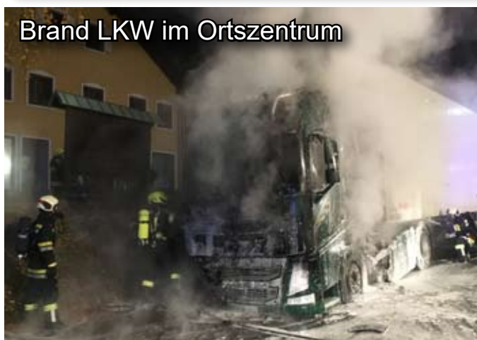
Brand LKW im Ortszentrum