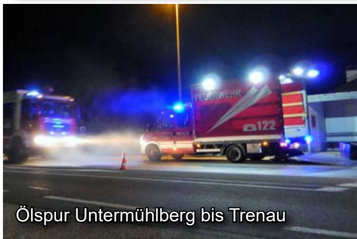
Ölspur Untermühlberg bis Trenau