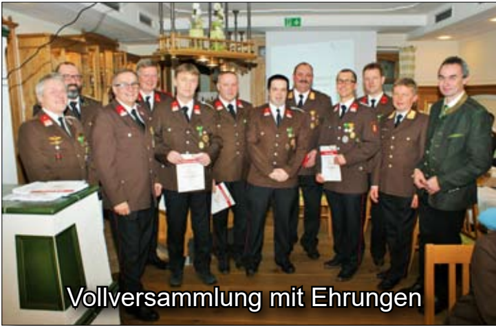
Vollversammlung mit Ehrungen