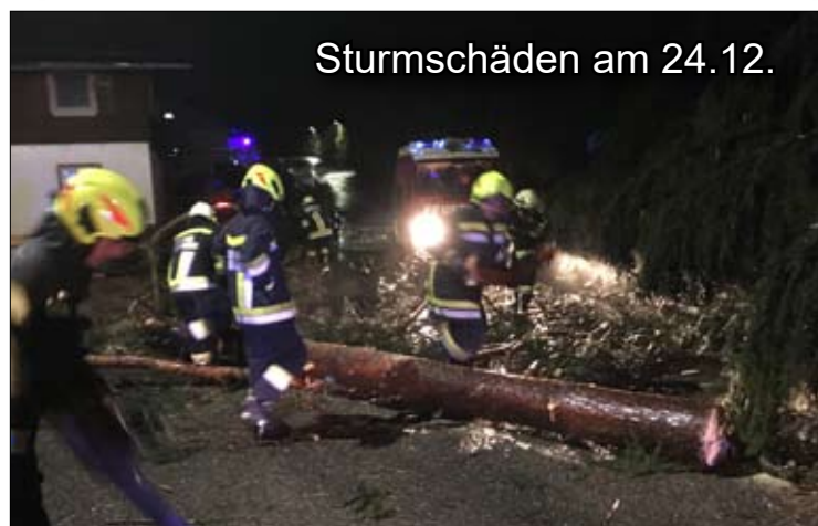
Sturmschäden am 24.12.