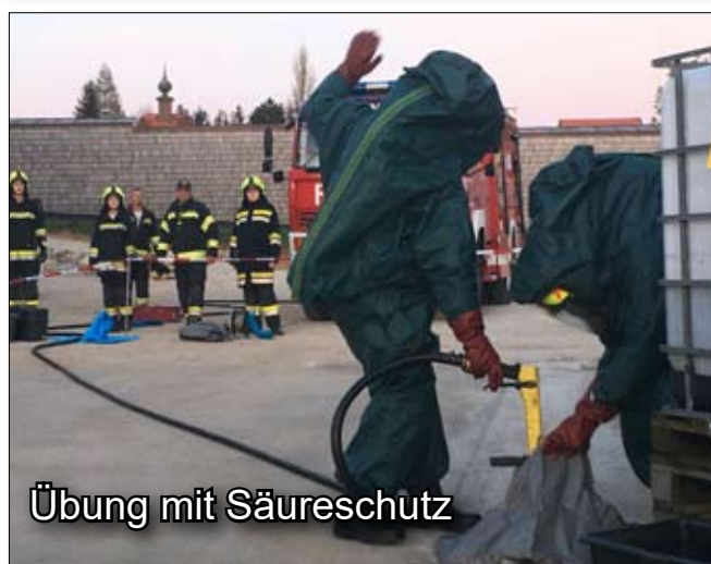
Übung mit Säureschutz